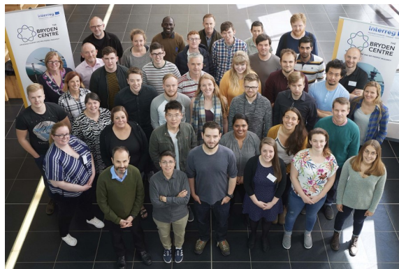
Doctorants et chercheurs post-doctorales du Centre Bryden