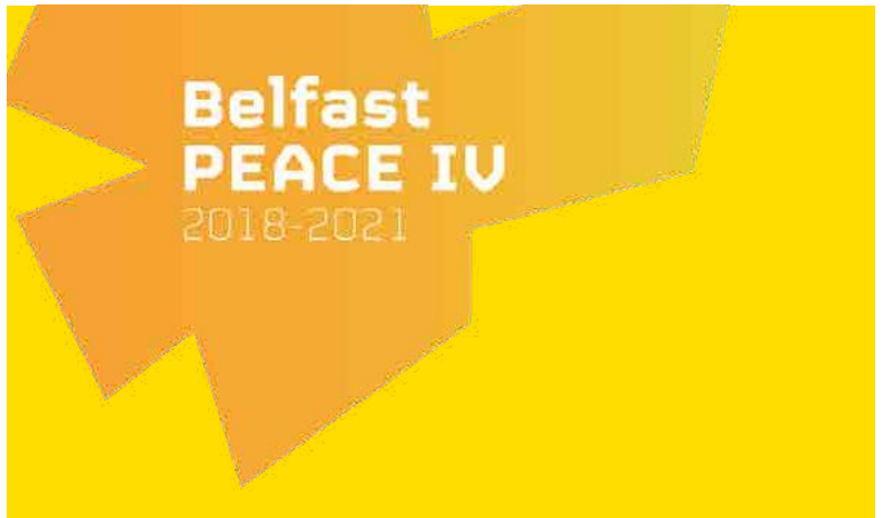
figure Transform for Change [Transformer en faveur du changement]. Depuis que le programme a commencé fin 2019, plus de 250 participants y ont pris part, lesquels se consacreront à des projets conjoints au sein de leur communauté. Ce cours de leadership composé de 10 modules est ouvert aux citoyens, aux décideurs et aux prestataires de services publics et étatiques. Il vise à renforcer les compétences en leadership et les approches axées sur les solutions afin de travailler collectivement à la résolution des problèmes liés à la ségrégation, aux préjugés et à la haine.

Parmi les projets portant sur l'établissement de relations constructives