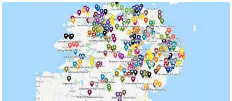
Une carte virtuelle de l'ensemble des écoles prenant part au projet CASE. L'équipe espère que toutes les écoles pourront un jour participer ensemble à une marche virtuelle.

Ce projet a été cofinancé par le ministère de l'Éducation d'Irlande du Nord et le ministère de l'Éducation et des Compétences d'Irlande.