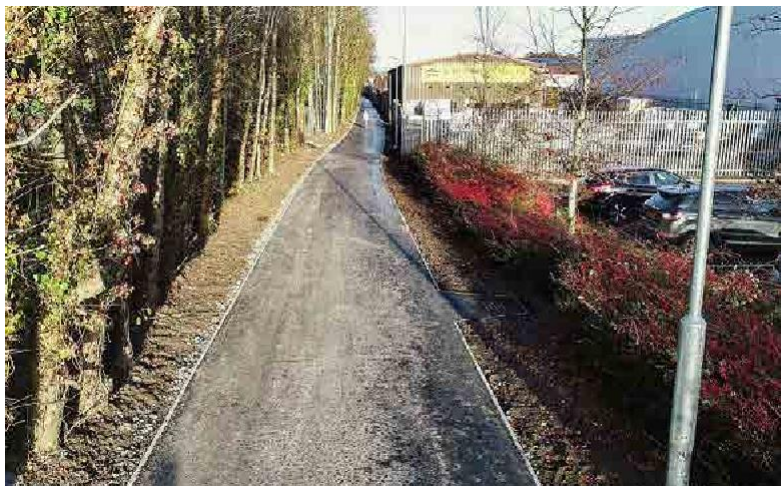
Les travaux portant sur le contournement de Strabane sont sur le point de s'achever.

Ce projet a été cofinancé par le ministère de l'Infrastructure d'Irlande du Nord et le ministère des Transports d'Irlande.