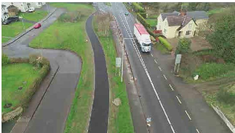
Vue aérienne d'un tronçon à Lifford reliant l'école primaire de Murlog au centre-ville de Strabane.

Cet aménagement relève de l'itinéraire 3 (Lifford – Strabane) du projet de réseau de voies vertes du nord-ouest de 14,9 millions d'euros.