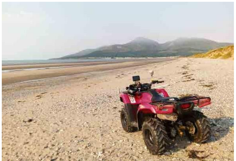
Ces études régulières sont menées sur le tronçon du littoral entre Newcastle et Dundrum afin de comprendre comment et pourquoi notre littoral change.

Le projet MarPAMM a été cofinancé par le ministère de l'Agriculture, de l'Environnement et des Affaires rurales d'Irlande du Nord et le ministère du Logement, des Collectivités locales et du Patrimoine d'Irlande.