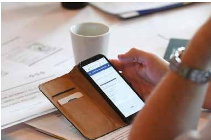
Au cours des événements, les participants ont pu faire part de leurs commentaires sur les objectifs stratégiques potentiels du nouveau programme PEACE Plus.