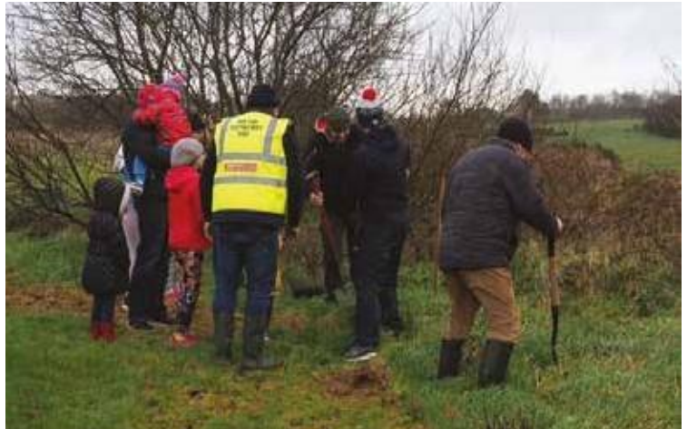
Des membres du groupe des « Amis de la rivière Callan » plantent des arbres dans le cadre de leur projet CatchmentCARE financé au titre du CIS.

Le Community Incentive Scheme , qui vise à aider les communautés locales à contribuer à une meilleure gestion de leurs bassins hydrographiques, était ouvert à un large éventail d'organisations, dont des groupes de bénévoles, des groupes communautaires, des ONG, des écoles et des organisations de l'enseignement supérieur, des groupes de jeunes et des clubs sportifs, des organisations à but non lucratif et