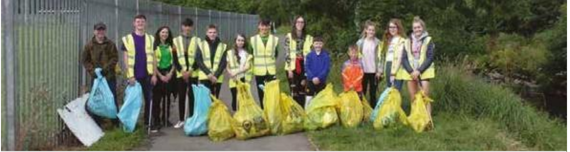
Des jeunes des écoles locales aident les « Amis de la rivière Callan » lors d'un événement communautaire de ramassage de déchets sur les rives de la rivière Callan.

Dans le cadre du projet CatchmentCARE [Entretien des bassins], d'un montant de 13,8 millions d'euros, financé par le programme INTERREG VA , plusieurs groupes communautaires locaux, au sein des trois bassins versants concernés par le projet, ont bénéficié d'un financement au titre du Community Incentive Scheme [Mécanisme d'incitation communautaire, CIS].