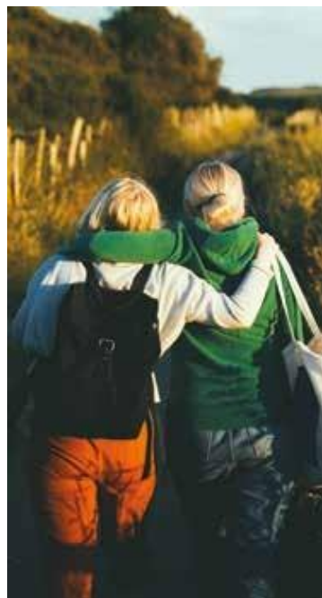
Le projet Our Generation bénéficiera à environ 35 000 enfants, jeunes et adultes en Irlande du Nord et dans la région frontalière de l'Irlande.

Ce projet a été cofinancé par l'Exécutif d'Irlande du Nord et le ministère du Développement rural et des communautés d'Irlande.