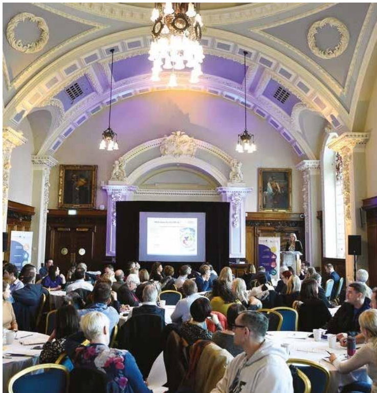
Des participants à l'événement d'engagement des parties prenantes au Belfast City Hall.

De plus amples détails concernant le programme PEACE Plus figurent à la page suivante : https://seupb.eu/peaceplus .