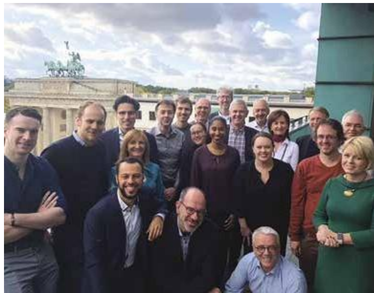
L'équipe de Belfast participant à une réunion du consortium Passion-HF en octobre 2019.

Pour plus d'informations, rendez-vous sur : www.nweurope.eu/projects/project-search/passion-hf-patient-self-care-using-ehealth-in-chronic-heart-failure/