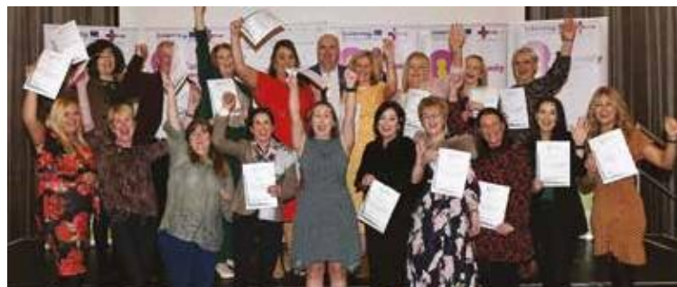
Remise des diplômes de facilitateur de la santé du projet CoH-Sync

Les projets menés par le CAWT dans le cadre du programme européen INTERREG VA ont été cofinancés par les ministères de la Santé d'Irlande et d'Irlande du Nord.