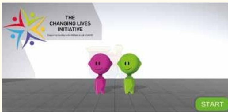
Une illustration de la nouvelle application.

L'application aidera les familles à comprendre en quoi consiste le TDAH et fournira des outils et des stratégies pratiques que les parents pourront utiliser avec leurs enfants. Elle est particulièrement pertinente pour les parents préoccupés par le comportement de leur enfant sans être sûrs qu'il souffre de TDAH. Par ailleurs, l'application sera extrêmement utile pour les personnes travaillant avec des enfants en les aidant à comprendre le TDAH et comment elles peuvent soutenir les enfants présentant des problèmes d'inattention, d'hyperactivité ou d'impulsivité.