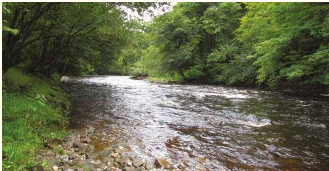
La rivière Faughan, à Derry-Londonderry, est sujette à des inondations intenses et soumise aux effets du changement climatique.

De plus amples informations sont disponibles à l'adresse suivante : http://climate.interreg-npa.eu/ .