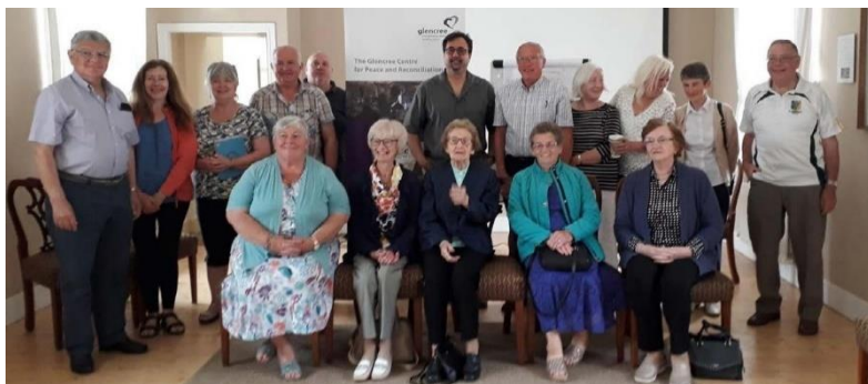
Des participants au programme Community Dialogue Circles, qui ont pris part à une visite consacrée aux bonnes pratiques au Glenree Centre for Peace and Reconciliation [Centre de Glenree pour la paix et la réconciliation].

Dans le cadre du programme d'histoire et de patrimoine, les enfants âgés de 7 à 12 ans des régions de Carrickmore, de Sixmilecross, de Beragh et d'Omagh ont participé à plusieurs excursions d'une journée, parmi lesquelles la journée de modélisme ferroviaire organisée par la visite de l'Ulster Folk and Transport Museum et un voyage en train de Derry-Londonderry à Coleraine. Les adultes,