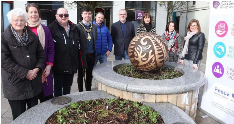
La vidéo spéciale consacrée à l'héritage du programme PEACE IV du Conseil municipal de Causeway Coast and Glens rend compte des témoignages des participants.

Ce projet a été cofinancé par l'Exécutif d'Irlande du Nord et le ministère du Développement rural et des communautés d'Irlande.