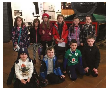
De jeunes enfants lors de la Journée du modélisme ferroviaire à l'Ulster Folk and Transport Museum dans le cadre du projet Railways to the West.

Le Plan d'action a été cofinancé par l'Exécutif d'Irlande du Nord et le ministère du Développement rural et des communautés d'Irlande.