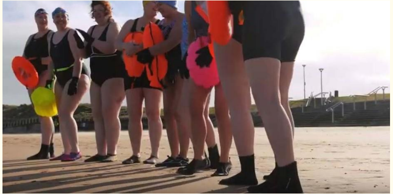
Les Menopausal Mermaids sont l'un des nombreux groupes aidant à soutenir et à promouvoir le projet SWIM.

Parmi les autres initiatives de promotion figure la série « Stories from the beach » [Histoires de plage], dans laquelle les