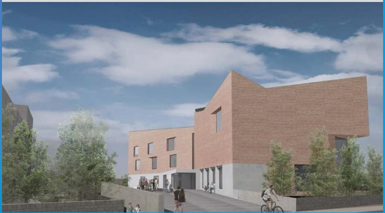
Composition graphique du Monaghan Peace Campus.

Le village de Pomeroy, dans le comté de Tyrone, au sein duquel le projet Connecting Pomeroy encouragera des contacts intercommunautaires plus nombreux.