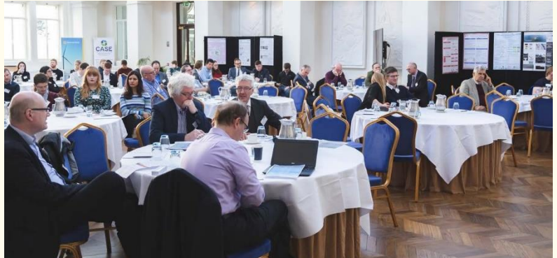
Les délégués assistant à la conférence Engineering & Energy Transition , qui s'est tenue au mois de février.

Un rapport a récemment été produit dans le cadre du projet, en collaboration avec le Centre for Advanced Sustainable Energy (Centre pour les énergies renouvelables avancées, CASE), élaboré en réponse au document d'orientation Rebuilding a stronger economy - the medium-term recovery towards a more competitive, inclusive and greener economy [Reconstruire une économie plus forte – la relance à moyen terme vers une économie plus compétitive, inclusive et verte] publié en juin 2020 par le ministère de l'Économie d'Irlande du Nord.