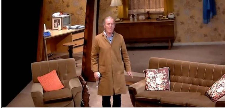
Extrait de la représentation d' Anything Can Happen 1972 , dans le cadre de l'événement de clôture officiel du projet.