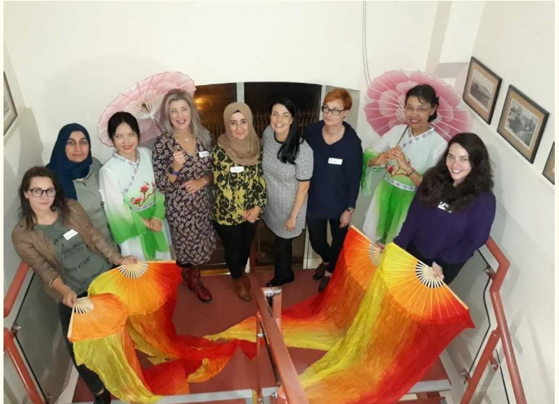
Quelques-unes des participantes et des artistes lors de l'événement de célébration de Newry qui s'est tenu le 7 octobre 2019, pour marquer l'achèvement du programme de 10 semaines.

L'un des participants du groupe de Newry a tellement apprécié le programme PRISM qu'il a mis en œuvre, au nom du Newry Interchurches Forum [Forum interéglises de Newry], un autre programme de 10 semaines proposant des activités similaires, dont des excursions de deux jours à Newcastle et à Darkley House, dans le comté d'Armagh.