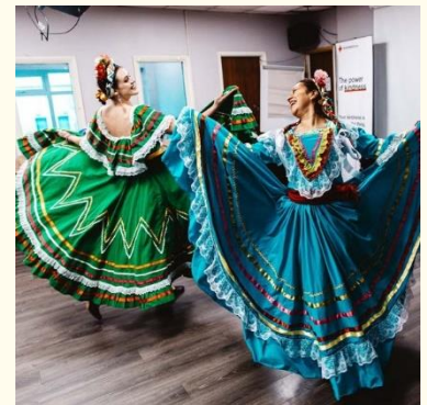
Des danseuses et une chanteuse se produisant lors de l'événement de célébration du groupe de North West Belfast, qui s'est tenu au New Life Centre, à Belfast, le 16 janvier 2020.

Ce projet a été cofinancé par l'Exécutif d'Irlande du Nord et le ministère du Développement rural et des communautés d'Irlande.