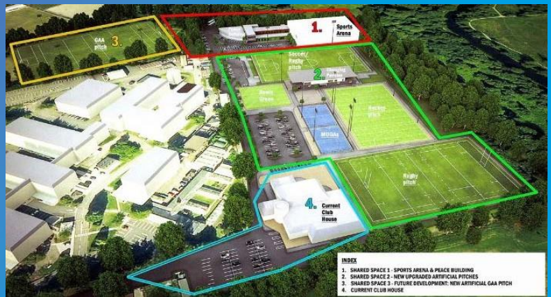
Plan du site du Newforge Community Trust Development.

Situé près de la rivière Lagan et de Newforge Lane dans South Belfast, le projet mené par le Newforge Community Development Trust entend aménager un site de six hectares qui sera mis à la disposition des groupes communautaires, des groupes de jeunes, des écoles, des églises, des clubs sportifs, et des habitants locaux sur une base intercommunautaire. Au cours des 60 dernières années, ce site a été utilisé exclusivement par la RUC Athletic Association et les membres du Service de police d'Irlande du Nord (PSNI). Les nouveaux plans transformeront ainsi ce site, qui deviendra accessible à tous.