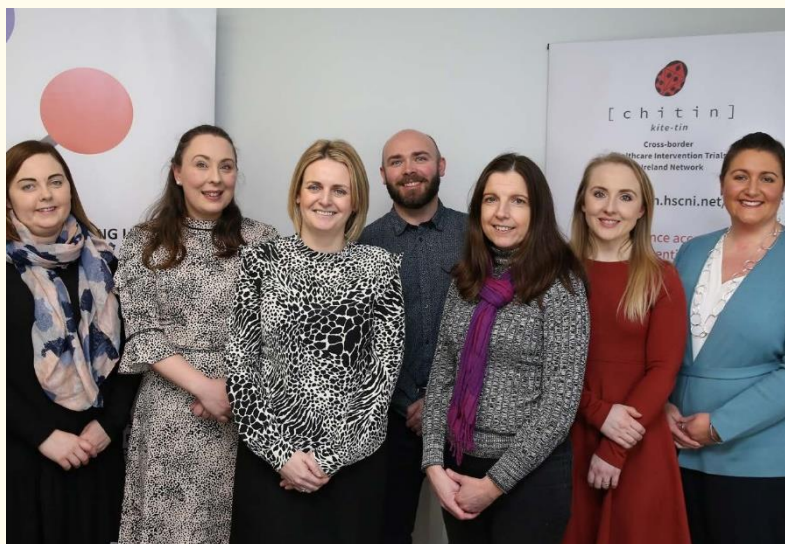
Certains membres de l'équipe de mise en œuvre du projet CHITIN photographiés début 2020.

Ce projet a été cofinancé par les ministères de la Santé d'Irlande du Nord et d'Irlande.