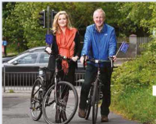
Le neuvième appel à projets lancé dans le cadre du programme Europe du Nord-Ouest est ouvert jusqu'au 14 juin 2019.

Depuis le début de la période de programmation, en 2014, 55 projets ont été approuvés (21 sur l'Innovation, 23 sur la Réduction du carbone et 11 sur l'Efficacité des ressources et des matériaux) et 177 millions d'euros ont été affectés à ces projets. Cela ne tient pas compte des projets en cours de développement des septième et huitième appels.