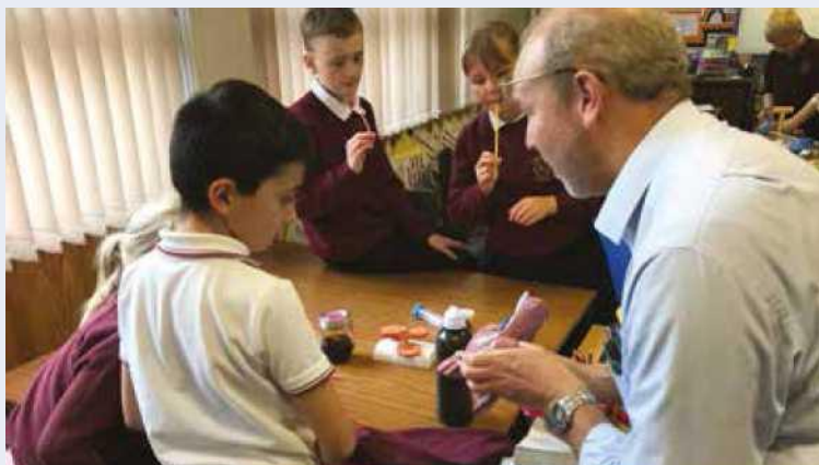
À ce jour, plus de 1 700 élèves ont été directement impliqués dans cette campagne d'éducation dans le cadre du projet.

est la troisième cause de décès dans le monde, et l'Irlande et l'Écosse enregistrent des taux de BPCO parmi les plus élevés au monde.