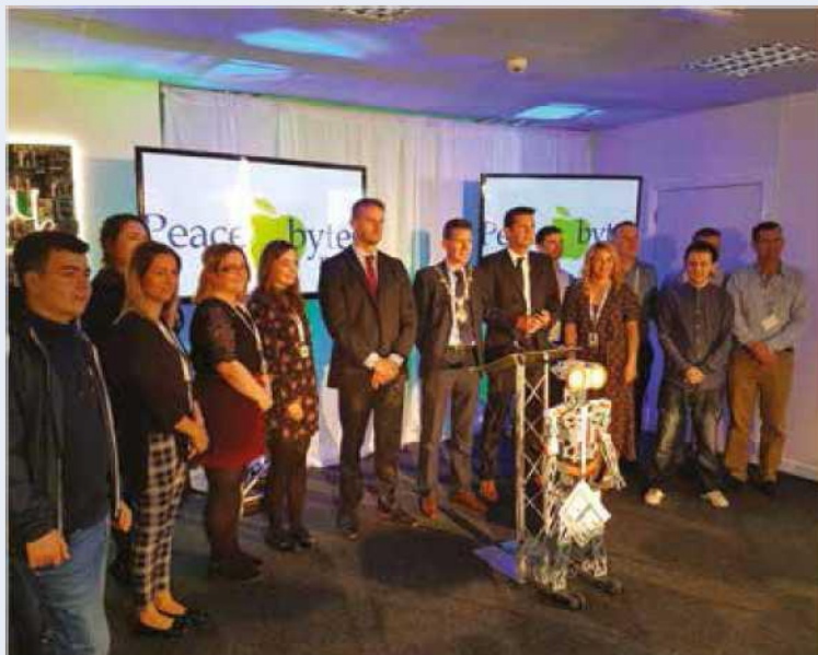
Le projet Peace Bytes, d'un montant de 3,8 millions d'euros, utilise les TIC de façon créative pour renforcer le pouvoir d'action des jeunes de la région.

Lors de l'événement de lancement du projet, les invités ont pu voir des exemples des travaux menés par le premier groupe de jeunes à avoir participé au programme Peace Bytes, et entendre des jeunes et des animateurs socio-éducatifs évoquer leurs plans futurs.