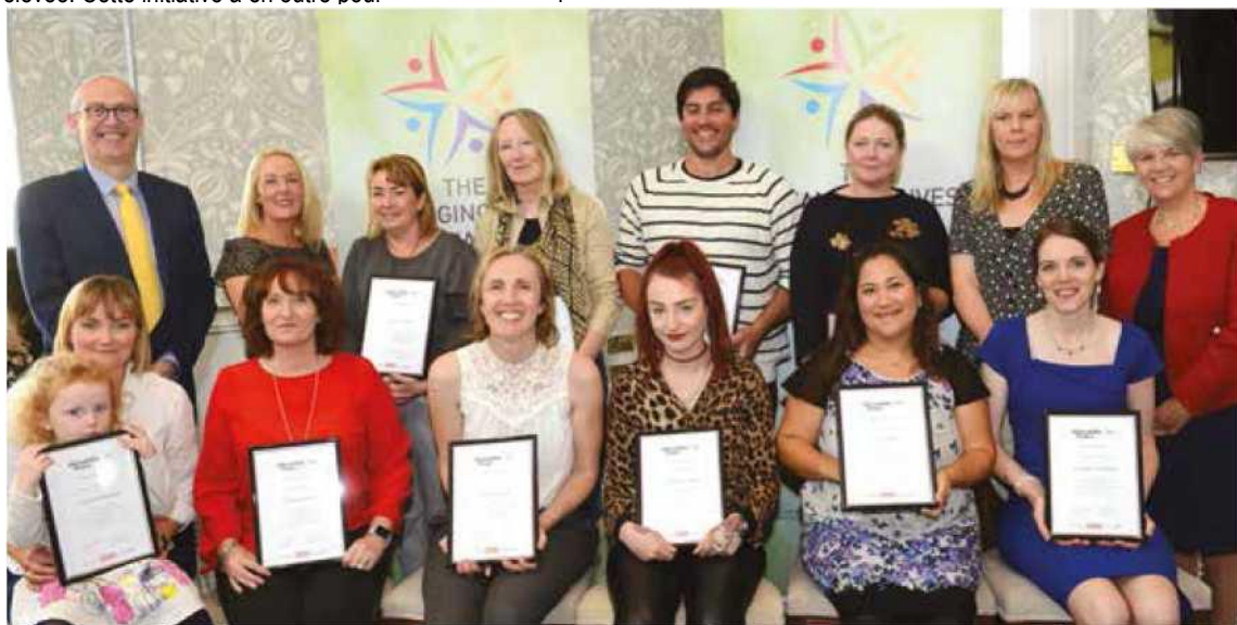
Des parents ayant pris part au programme mené par le comté de Louth de la Changing Lives Initiative collectent leur certificat attestant de leur participation à la formation.