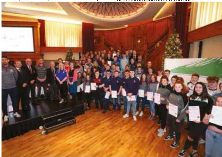
Les jeunes bénévoles prenant part à l'initiative Sport Uniting Communities [Union des communautés par le sport] de 1,7 million d'euros, financée dans le cadre du programme PEACE IV, ont récemment célébré leur dévouement au projet lors d'une cérémonie spéciale qui s'est tenue au Titanic, Belfast.

Ce projet a été cofinancé par l'Exécutif d'Irlande du Nord et le ministère du Développement rural et des communautés d'Irlande.