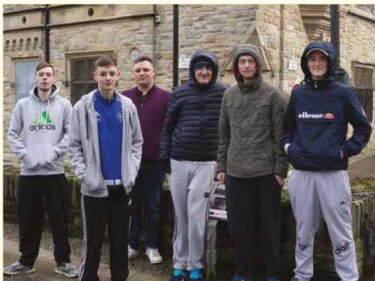
Certains des jeunes hommes impliqués dans le projet MPOWER, d'un montant de 3,5 millions d'euros.

Certains des jeunes hommes du groupe ont depuis trouvé un travail. De son côté, Georgia, effectue du travail bénévole et a été admise à un cours de photojournalisme d'une école locale.