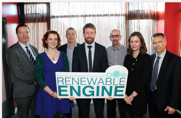
Des partenaires présents au lancement officiel du projet Renewable Engine

Instituts de recherche participant à des projets de recherche transfrontaliers, transnationaux ou interrégionaux : 4