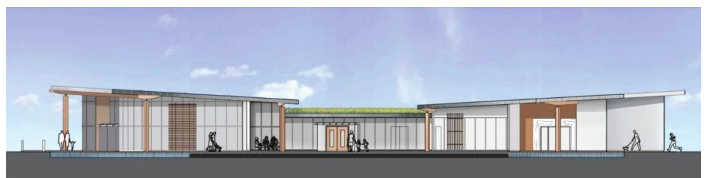
Composition graphique du bâtiment du projet Riverine